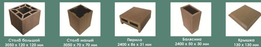
Столб большой 3050 x 120 x 120 мм